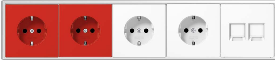
PUESTO N° 2