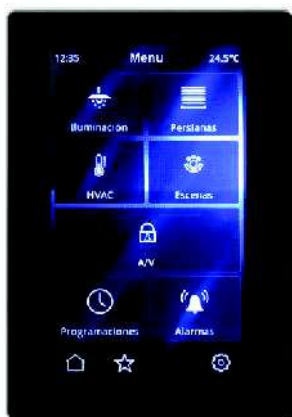
Pantalla táctil capacitiva de 4.3''