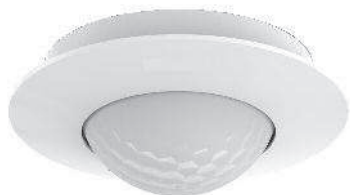
Detector de movimiento