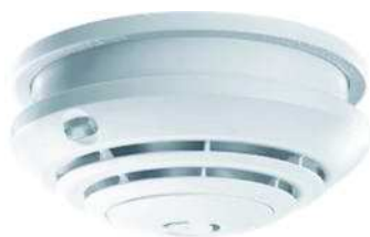
Detector de humo