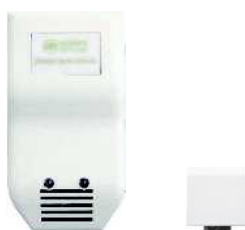
Detector de inundación y sondas