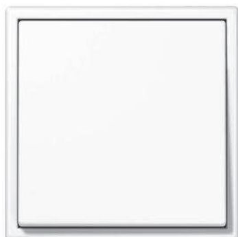
Tecla simple para pulsadores de iluminación